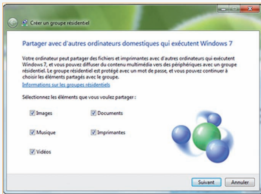
Figure 1 Fonction groupe résidentiel de Windows 7

Lorsque vous achetez un nouveau PC, la première étape consiste à installer le système d'exploitation et de régler les paramètres de base de la machine, telle que la connexion à Internet par exemple. La bonne nouvelle est que ces opérations sont extrêmement faciles et rapides sous Windows 7. Je n'ai noté pour ma part aucune difficulté significative. À l'image de Mac OS, la connexion à Internet est très simple. Il suffit de reconnaître le nom de votre borne d'accès ou de votre modem ADSL, puis de saisir la clé WEP correspondante, indiquer enfin s'il s'agit de votre domicile ou de votre lieu de travail et le tour est joué.